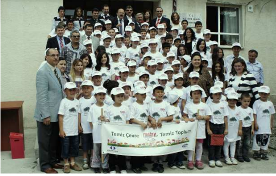
Kayapa ilköğretim okulunda Çevre Eğitimi, 2012