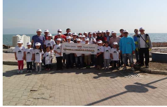
Burgaz Sahil Temziliği, 2012