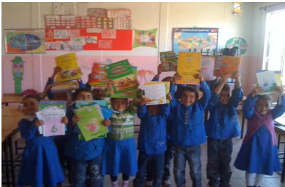
Doğu illerimizdeki çocuklarımızı destek, 2011